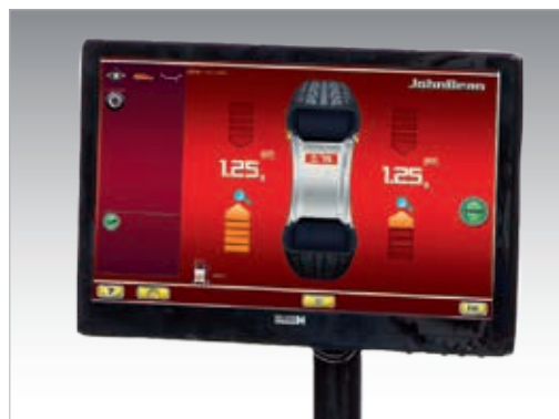
interface utilisateur platinum