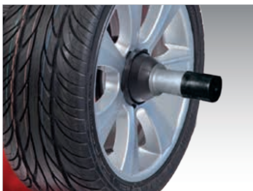
Dispositif de serrage power clamp